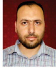
أ. ادب سويدان نائب الرئيس